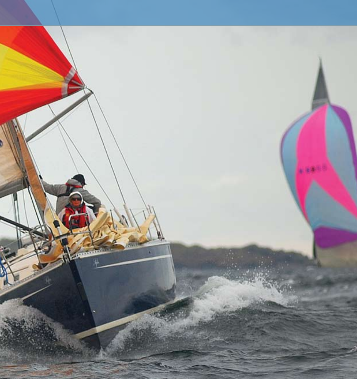
Å seile regatta kan koste deg 2000 kroner i økt forsikringspremie.