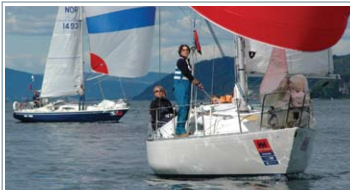
Lengde: 30 fot • Årsmodell: 1982 • Motor: 12 hk • Antatt verdi: 200.000 kroner • Eier 33 år.