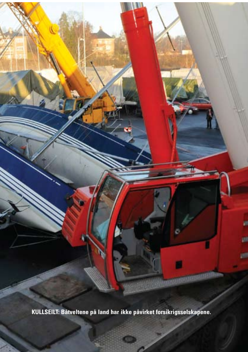
KULLSEILT: Båtveltene på land har ikke påvirket forsikringselskapene.

Vi har brukt priskalkulatoren til Atlantica for å se om vi får noe igjen for å seile en kvalitetsbåt og satte opp en Hallberg-Rassy mot en Bavaria med produksjonsår 2000 og verdi på 1.000.000. Resultatet viste at den svenske forsikringstilbyderen gir over 500 kroner i rabatt til eieren av Halberg-Rassy.