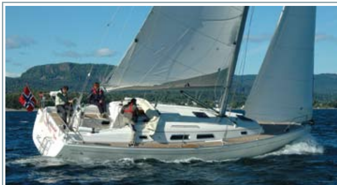
Lengde: 37 fot • Årsmodell: 2008 • Motor: 28 hk • Antatt verdi: 1.000.000 kroner • Eier 41 år.

Størst prisutslag var det på den dyreste båten. Her var TrygVesta nesten 16 000 kroner dyrere enn Quality Broker, som er mer enn det dobbelte av prisen.