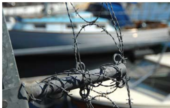
PENGER SPART: Atlantica gir fem prosent rabatt hvis båten ligger i bevoktet havn.