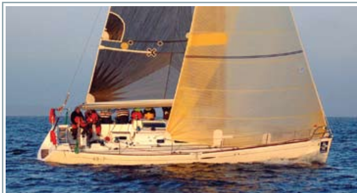
Lengde: 40 fot • Årsmodell: 2005 • Motor: 30 hk • Antatt verdi: 1.300.000 kroner • Eier 48 år.

og forhandler forsikring. If er et stort forsikringselskap som gjerne vil at du samler alle premiene hos dem. For Hanse 370 kan du da spare 2.500 kroner på dette, men selv da er prisen flere tusen kroner dyrere enn de billigste selskapene.