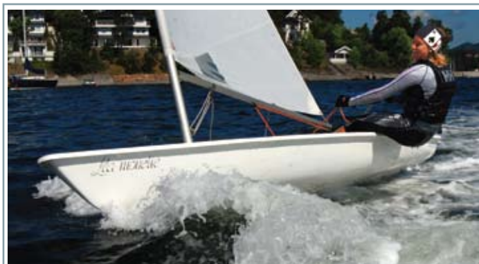
Lengde: 15 fot • Årsmøll: 2003 • Antatt verdi: 40.000 kroner • Eier 16 år.

– Vinterlagringen har ikke innvirkning på forsikringspremi- en. I utgangspunktet baserer års- prisen seg på at de fleste båter kun brukes i sommerhalvåret, forteller Anette Heggeneset fra Gjensidige til Seilas. Vinterseiling kan derfor bli en kostbar fornøyelse om noe skulle gå galt på tur, om du ikke har lest den lille skriften i betingelsene. Atlantica har en forsikring som heter lang , som gir deg rett til å bruke båten hele året. For Hanse 370 vil det koste rundt 800 kro-