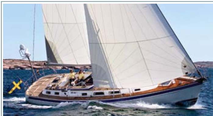
Lengde: 48 fot • Årsmodell: 1997 • Motor: 85 hk • Antatt verdi: 2.900.000 kroner • Eier 60 år.